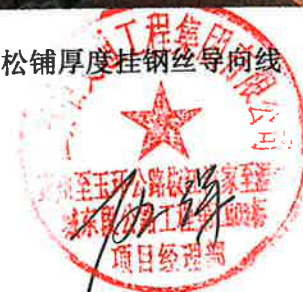
现场挂线人员按松铺厚度挂钢丝导向线