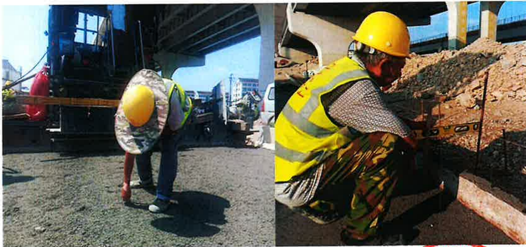
专人插检松铺厚度

整改措施： 下一步水稳基层施工过程中我部将严格控制松铺厚度，每日施工前，由测量人员根据设计高程、实测高程计算每一层水稳摊铺厚度，再按首件工程确定的松铺系数计算每断面松铺厚度，并下发给施工队。施工队负责测量放线人员根据每断面松铺厚度提前挂好控制导向线钢丝。在摊铺时，安排专人插检松铺厚度，确保水稳基层施工厚度满足设计规范要求。